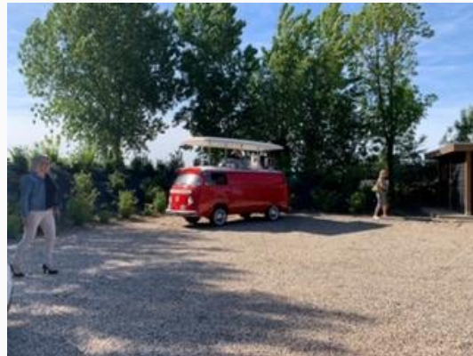
Foto's boven: Paasbrunch en swingen op muziek van de discobus. Foto onder: Beauty-avondje en de discobus op locatie.

En dat was het weer....We hebben voor nu niet meer te melden, maar wees gerust want over een aantal maanden komt er natuurlijk weer een nieuwsbrief!